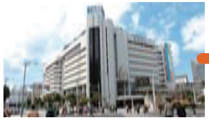
①パレットくもじ (那覇市歴史博物館) 「王朝文化と都市の歴史」をテーマとする博物館。国宝「琉球国王尚家関係資料」を常設展示。