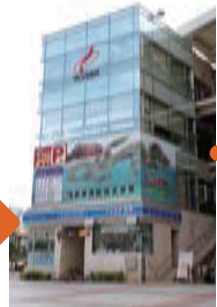
③てんぶす那覇 (那覇市伝統工芸館) 琉球舞踊やお笑いなどが楽しめる沖縄文化発信拠点。陶芸や琉球ガラスなどの伝統工芸も体験できる。